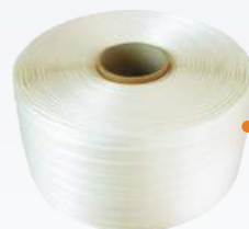
Rolka taśmy Typu WG